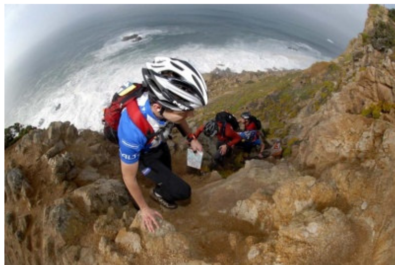
SMS under andra stäckans exponerade coasteering

Terrängen var överraskande fin med coasteering runt Europas västligaste udde som höjdpunkt. Inga kontroller las dock ute i vattnet då vågorna snittade på 5 meters höjd under tävlingens första dygn. Det var många tuffa cyklingar utan riktiga berg, utan mer upp och ner hela tiden. Det tredje dygnet dominerades av en lång paddling på drygt 50 km på Rio Tejo där vi bommade en halvtimme på att leta efter en kontroll på kartan som visade både ebb och flod. Problemet var bara att förstå vilket tecken som var vilket.