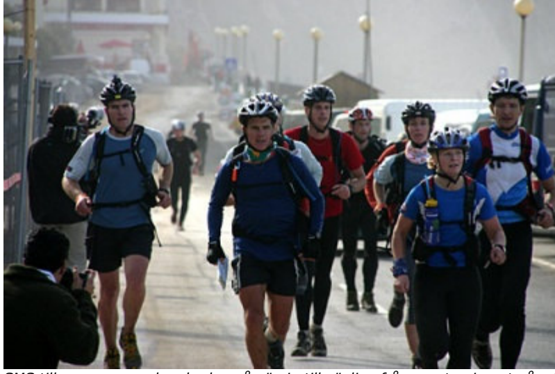
SMS tillsammans med andra lag på väg in till växling från coasteering ut på mtb.