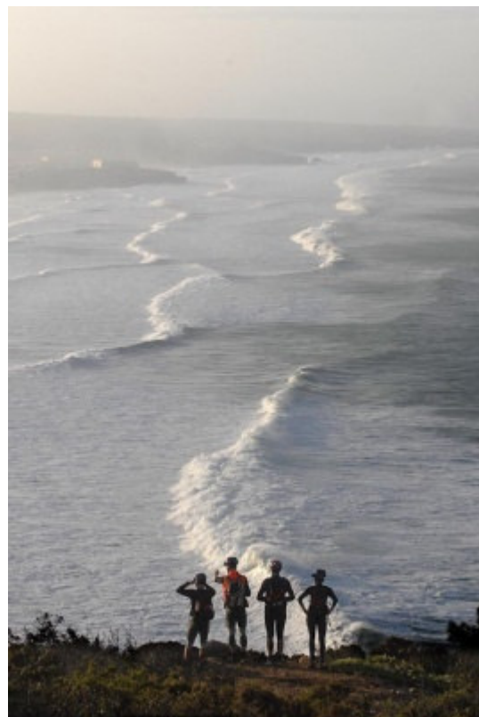
Deltagarna hade mycket fint väder tävlingen igenom.

Sundbyberg Multisports taktik att satsa på att orka ta alla obligatoriska kontroller och prioritera bort tuffa valfria kontroller i början visade sig vara rätt. T.ex. finska Master Unit körde bort sig från täten totalt, när det visade sig att de inte hann med alla obligatoriska punkter på slutet. I början såg de mycket starka ut.